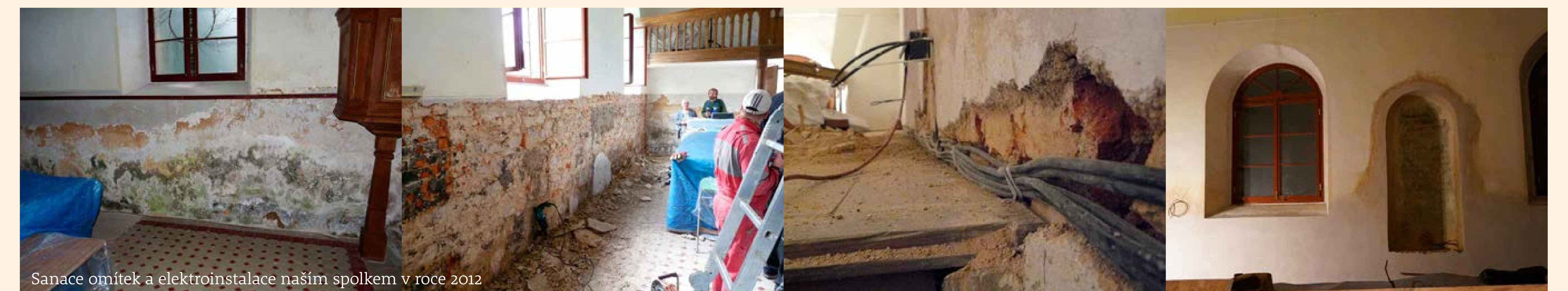
Sanace omítek a elektroinstalace našim spolkem v roce 2012