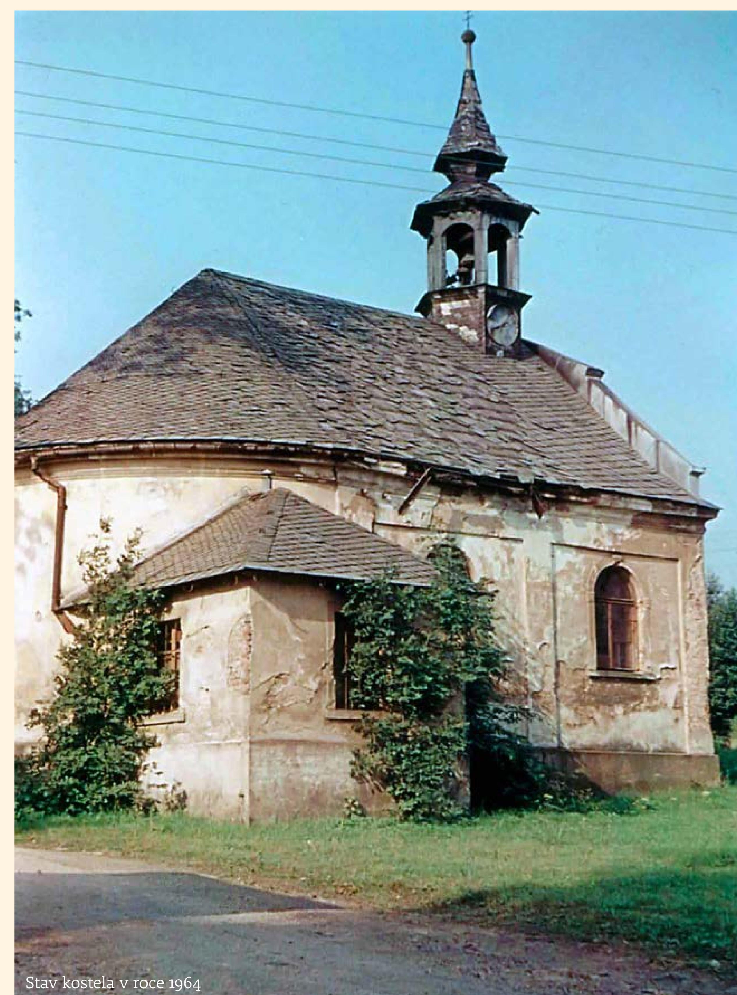
Stav kostela v roce 1964

Koncem minulého století zde utichnul život a budova chátrala. Od roku 2011 je kostel sv. Vojtěcha v péči místního občanského sdružení – Spolku přátel Ostašova – které zde pořádá různé benefiční akce pro jeho záchranu.