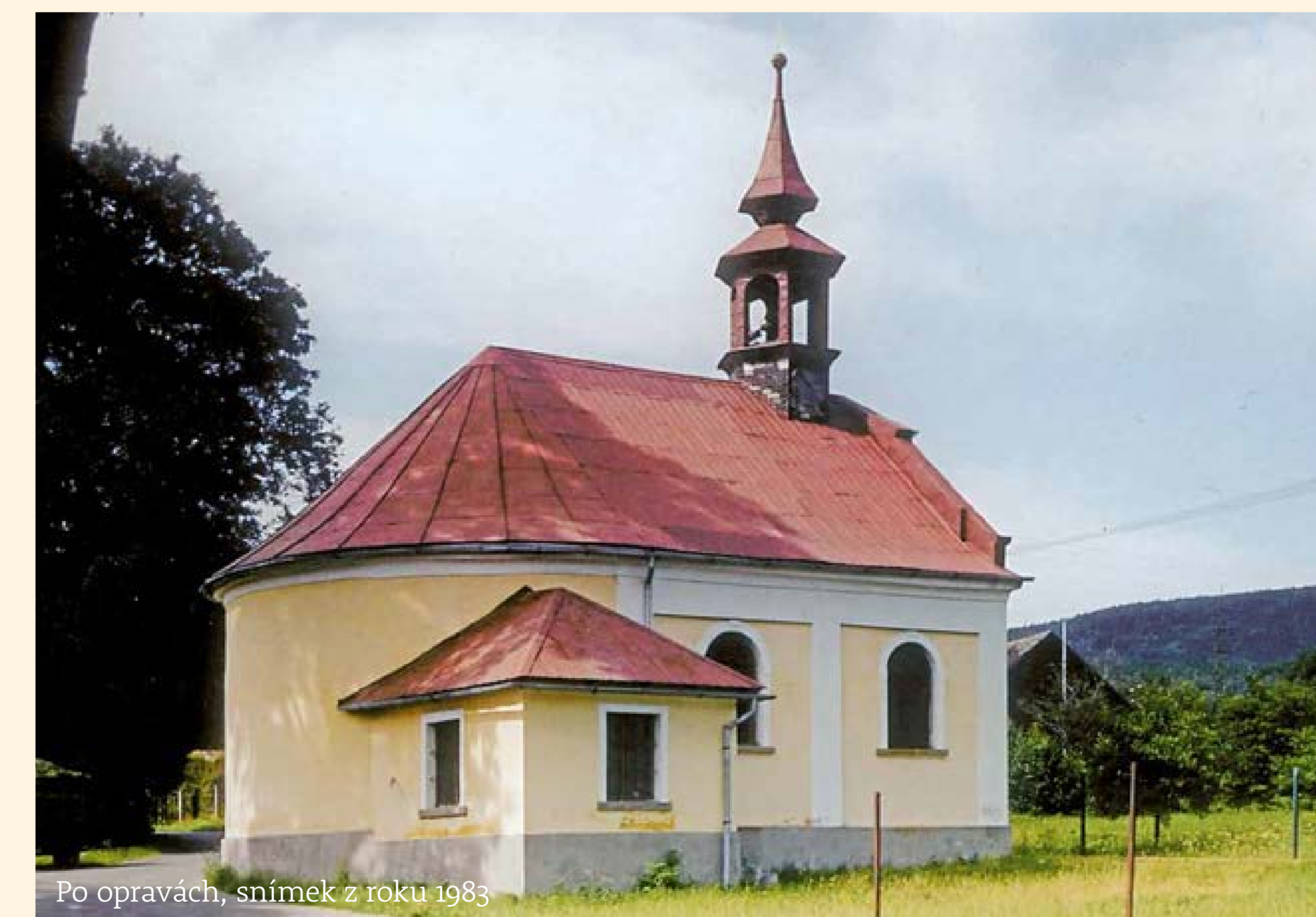
Po opravách, snímek z roku 1983

Am Ende des letzten Jahrhunderts wurde das Kirche lebenslos und das Kirchengebäude verfiel. Seit 2011 ist die Kirche in der Obhut der örtlichen Bürgervereinigung Ostaschovschen Freunde , welche durch kulturelle Veranstaltungen das Leben in der Kirche zurückgebracht und somit für seine Rettung sorgte.